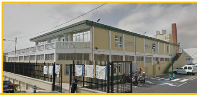
CMSS de Distrito Vegueta-Cono Sur-Tafira