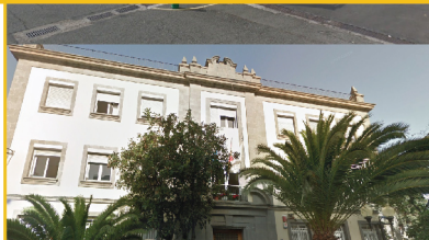
CMSS de Distrito Centro