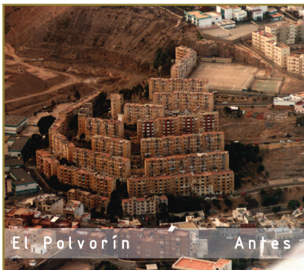
El Polvorín Antes