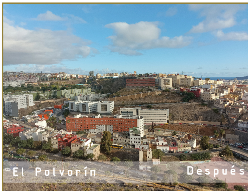
El Polvorín Después