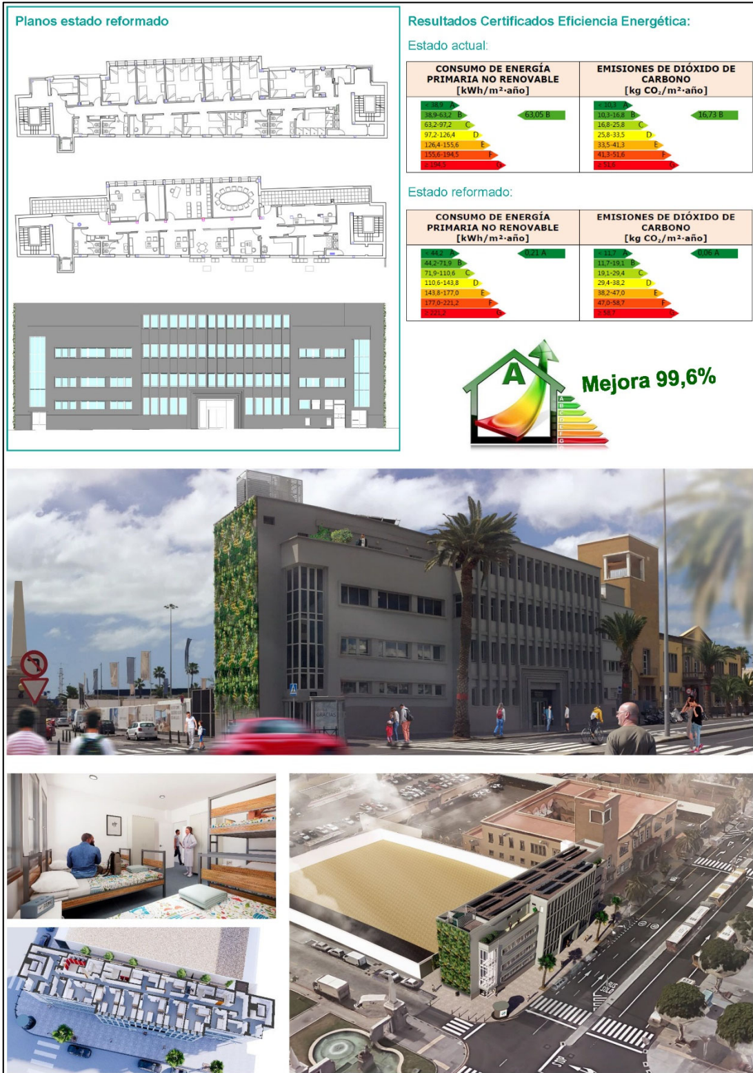
Ilustración 3. Formalización del inmueble municipal prevista con la rehabilitación subvencionada.