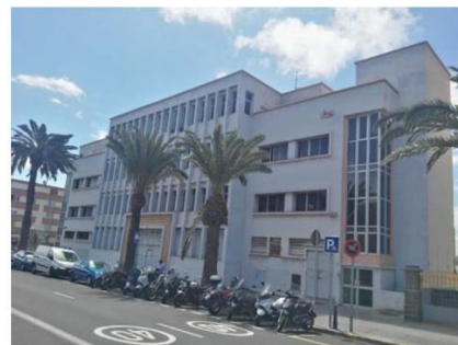
Ilustración 2. Resumen gráfico sobre la situación actual del inmueble municipal.