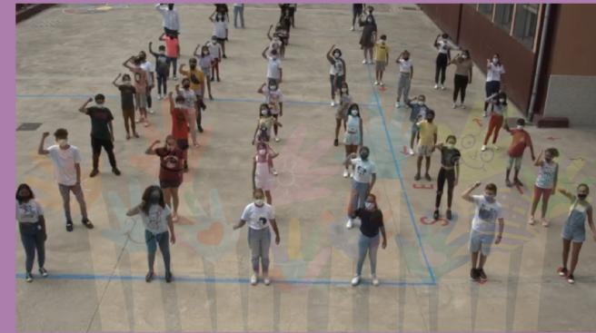
Encuentro con VOPIA (Voces de Órgano de Participación de la Infancia y de la Adolescencia) de Las Palmas de Gran Canaria

Vopia es el Órgano de las Voces y la Participación Infantil y Adolescente, que canaliza las motivaciones, inquietudes y, por lo tanto, la participación formal, democrática y de incidencia en la vida pública local de niñas, niños y adolescentes de Las Palmas de Gran Canaria. Tendrá carácter consultivo para el Gobierno local, promoviendo valores democráticos y donde se informará de las acciones que desde este se pongan en marcha, se expresen ideas y realicen propuestas de solución y mejora de distintos aspectos de las políticas públicas.