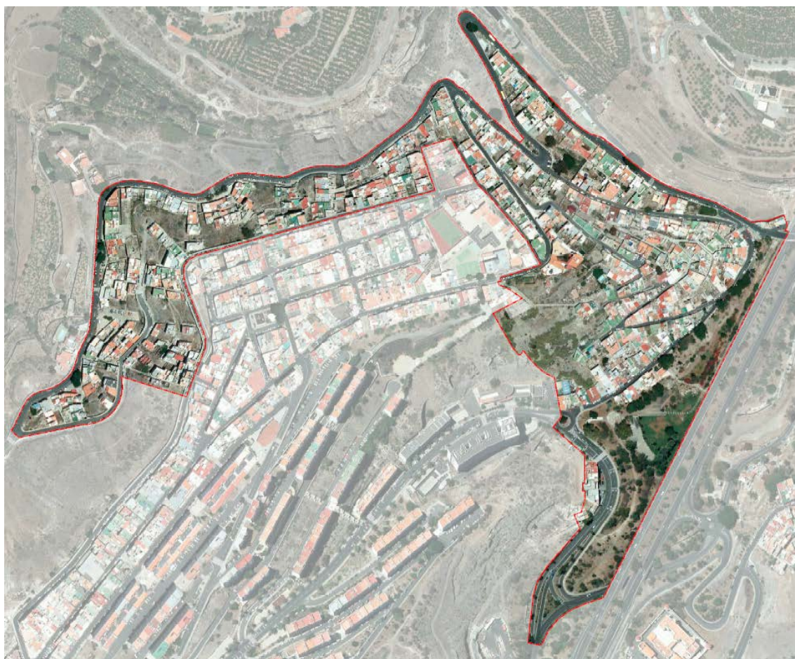
Delimitación del ámbito sobre ortofoto

La delimitación gráfica de ámbito se define en el plano de ordenación O.01 "Delimitación del ámbito".